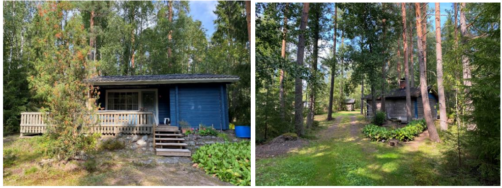
Lomarakenus ja talousrakennuksia voimassa olevan ranta-asemakaavan korttelin 24 rakennuspaikalla 1.