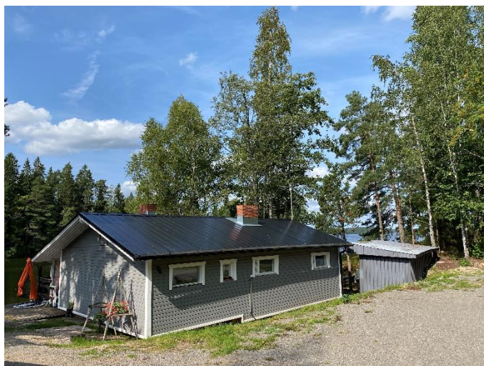
Lomarakenus ja talousrakennus voimassa olevan ranta-asemakaavan korttelin 39 rakennuspaikalla 3.