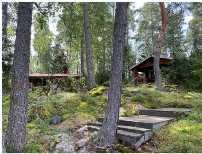
Lomarakenus ja talousrakennus voimassa olevan ranta-asemakaavan korttelin 24 rakennuspaikalla 2.