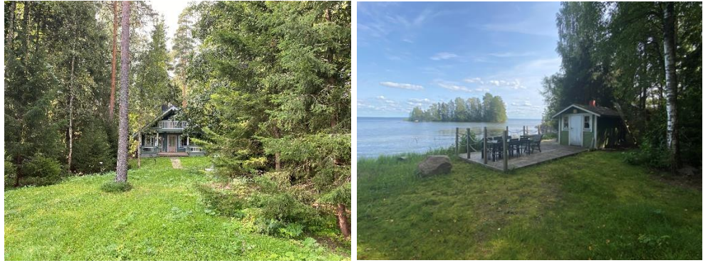
Lomarakennus ja saunarakennus voimassa olevan ranta-asemakaavan korttelin 40 rakennuspaikalla 1.